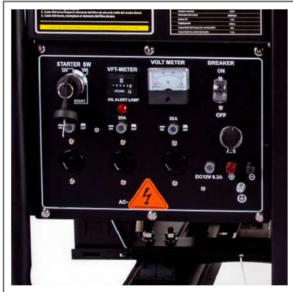
Tablero de conexión