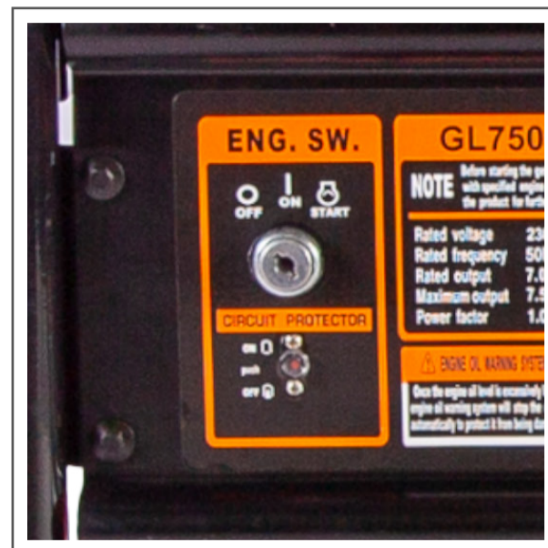
Arranque eléctrico con control remoto