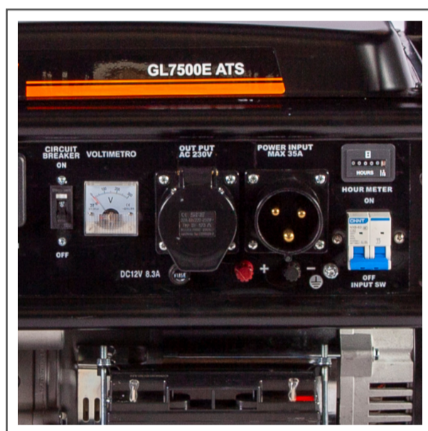
Conexiones de entrada y salida