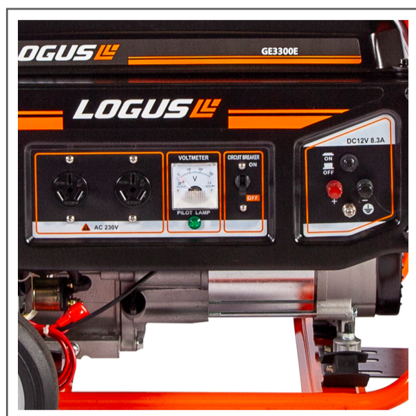
Panel de conexión y salida de 12V