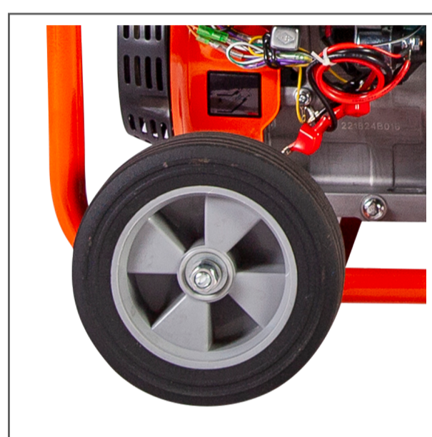
Ruedas y manijas de traslado