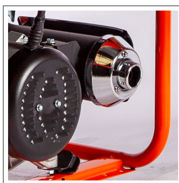
Caño de escape